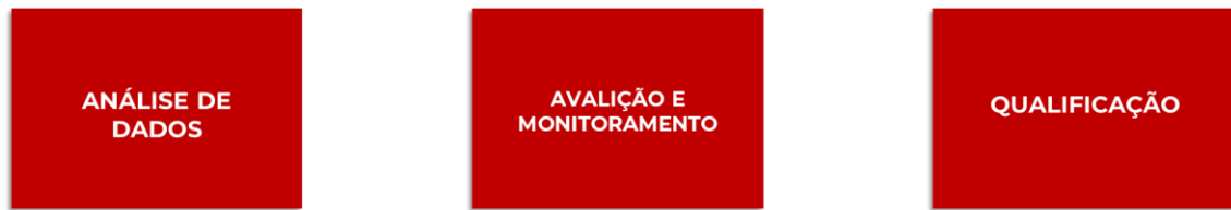
Figura 01 – Pilares do Departamento de Conformidade.